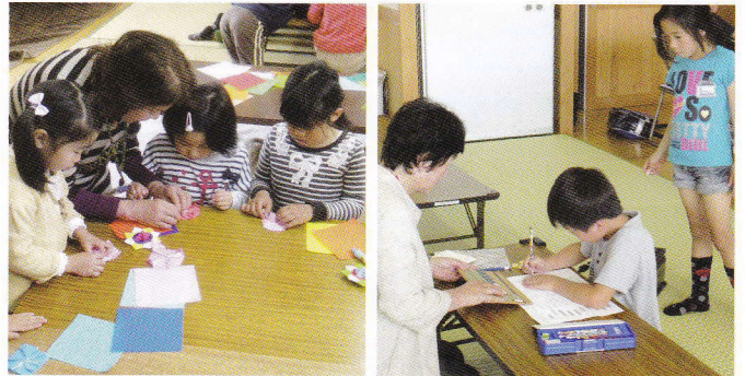
子ども教室や児童クラブは放課後の安全・安心な居場所

現在、300余名の個人、11の団体、20協力団体が登録。今年度は延べ約240名の方々が児童クラブや子ども教室の指導員や教育活動推進員、サポーター、夏休み・冬休み・春休み等の出前講座や体験学習の講師として活